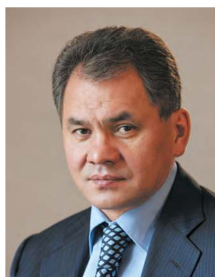
Генерал армии Шойгу С.К. Министр МЧС России с 1991 г. по 2012 г.